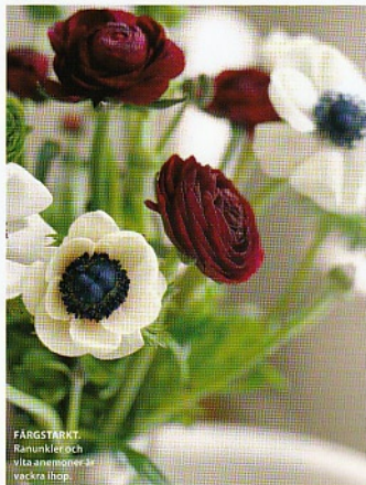
FÄRGSTARKT. Ranunkler och vita anemoner är vackra ihop.