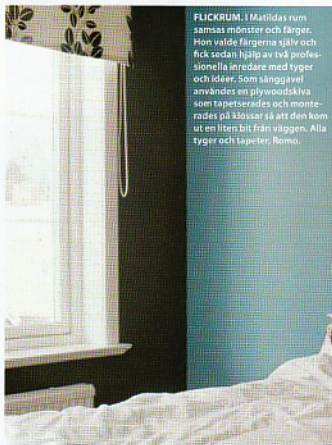
FLICKRUM. I Matildas rum samsas mönster och färger. Hon valde färgerna själv och fick sedan hjälp av två profes- sionella inredare med tyger och idéer. Som sänggavel användes en plywoodskiva som tapetserades och monte- rades på klössar så att den kom ut en liten bit från väggen. Alla tyger och tapeter, Romo.