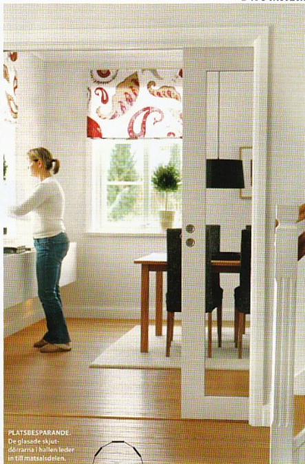
PLATSBESPARANDE. De glasade skjutdörrarna i hallen leder in till matsalsdelen.

– Ibland får man syn på ett läckert hus eller man kanske hör talas om en fin tomt och då börjar man fundera. Det är inte det att vi är missnöjda, men på något sätt är vi hela tiden på gång. Det roligaste är ju att planera, åka runt och titta på kakel, tapeter, golv och färg. För oss är det inte resans mål som är höjdpunkten utan resan i sig. ■