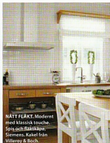
NÄTT FLÄKT. Modernt med klassisk touch. Spis och fläktkåpa, Siemens. Kakerl från Villeroy & Boch.

► – Vi kände att det inte var bra, men visste inte hur vi skulle komma vidare. Vi hade satsat på mycket ek och till slut blev det rena "ek-porren". Det blev på tok för mycket.