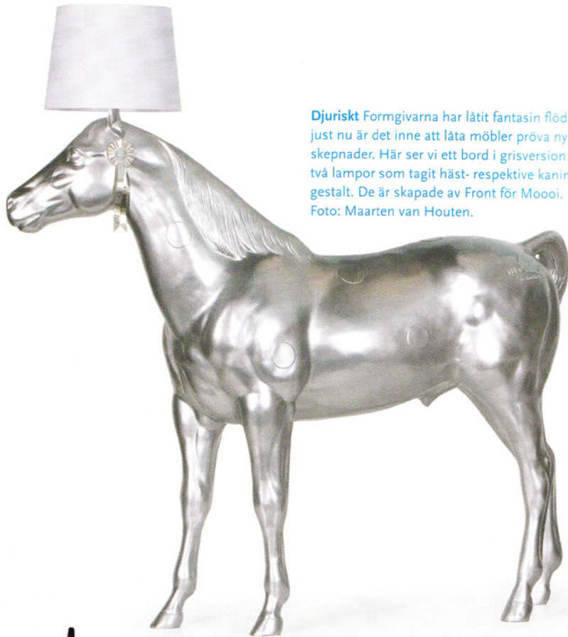
Djuriskt Formgivarna har låtit fantasin flöda och just nu är det inne att låta möbler pröva nya skepnader. Här ser vi ett bord i grisversion och två lampor som tagit häst- respektive kanin-gestalt. De är skapade av Front för Moooi.